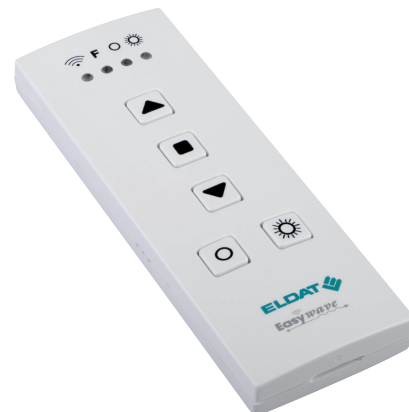
RT37E5001-01-02K auch in schwarz

Mit den Richtungstasten AUF/STOPP/ZU kann die Markise manuell gefahren werden.